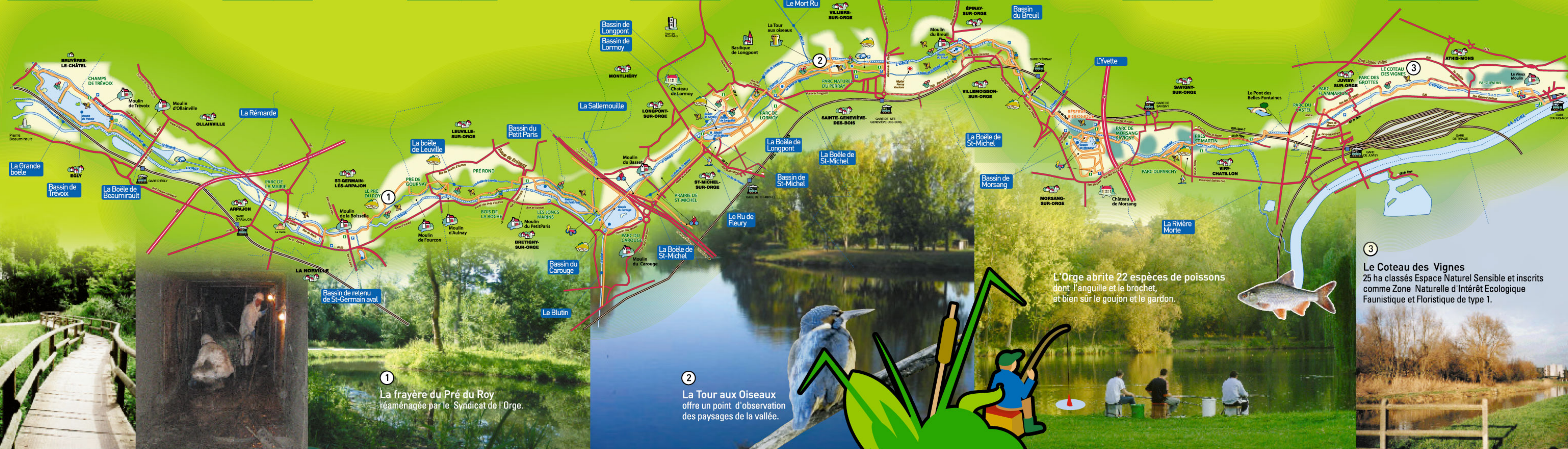
1 La frayère du Pré du Roy réaménagée par le Syndicat de l'Orge.