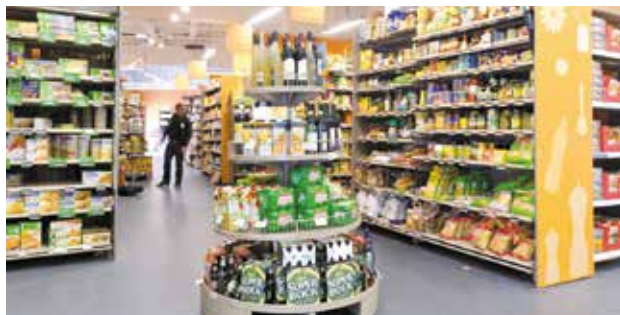
La limitation des déchets commence dès l'achat des produits.

C'est se procurer les produits neufs ou d'occasion dont on a besoin : les acheter, mais aussi les emprunter ou les louer. Lors de l'achat, c'est limiter les emballages, privilégier les produits durables, réutilisables, rechargeables et adaptés à nos besoins ! Voir pages 8 à 12.