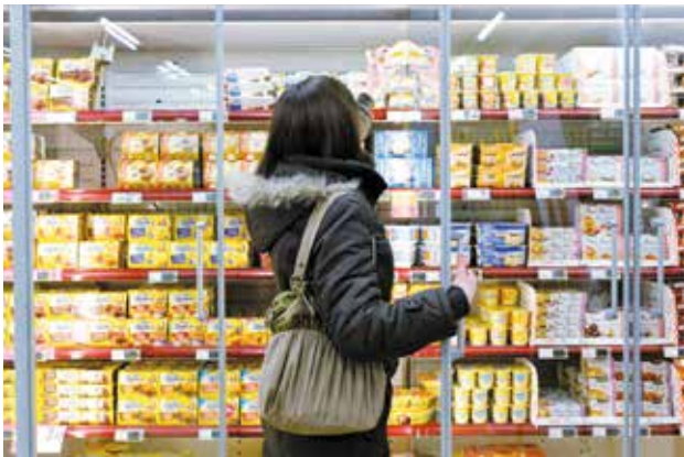
Évitez d'acheter des produits dont la date de péremption est proche.

vérifiez bien les dates de péremption des produits préemballés.